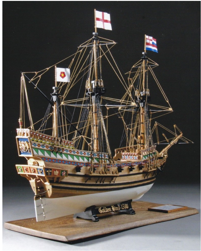
ゴールデンハインド Golden Hind 年代 1577年 縮尺 1/53 キャプテン・ドレークがエリザベス女王の支援により1577年から1580年にかけて スペイン植民地で略奪を重ねながらイギリス人として最初に世界一周を果たした

「ザ・ロープ」とは：1975年に日本で最初に結成された木製帆船模型製作を趣味とする同好会で、会員数114名。定期的に例会や研究会を行い、会員相互の技能向上と親睦をはかっているほか、底辺拡大のため初心者を対象とした帆船模型教室も開催しています。